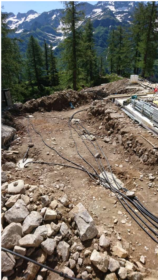
16 luglio 2019 – Fascio tubiero geotermica...